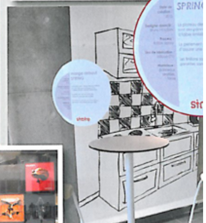
Ci-dessus, les tabourets et « debout » proposés par Simire implantée à Mâcon plan sur le cartel explicatif de la vitrine signée A4 Designers.

<<< Du peeps pour la vitrine d'opticien pensée par le collectif